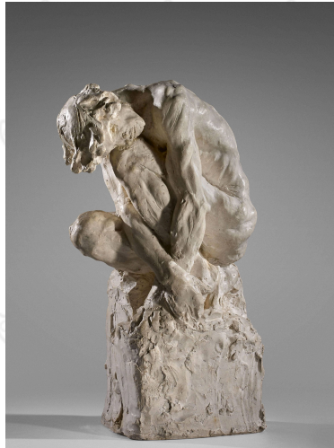
Claudel, C. (1886). El hombre inclinado [escultura, 43 x 16 x 128 cm]. Francia: Museo Camille Claudel.